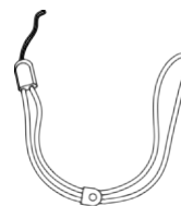
Wrist Strap (x1)